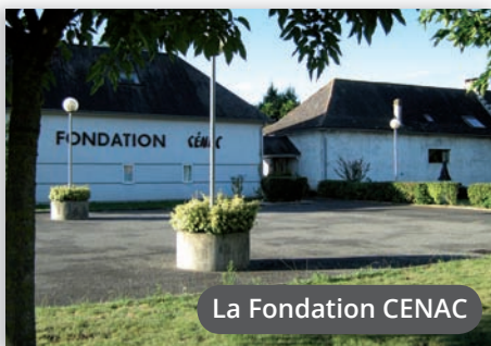
La Fondation CENAC

Visites : sur rendez-vous auprès de Secrétariat de Mairie