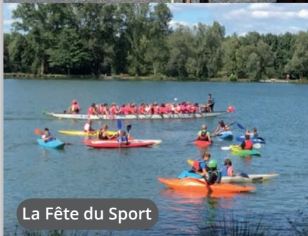
La Fête du Sport