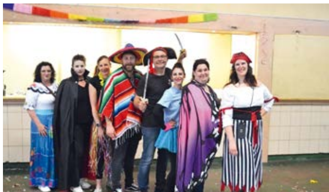
Une équipe dynamique qui organise le carnaval des enfants

Cette année 2024 a été particulièrement riche en événements pour l'association des parents d'élèves « Les enfants de Soues ». Pas moins de 10 événements ont jalonné l'année. Un vide grenier au bénéfice d'un projet de voyage scolaire de l'école élémentaire, des séances photo déguisées et l'organisation d'un « bal du carnaval » des écoles réunissant plus de 200 personnes, l'éternelle et incontournable « chasse aux œufs » de Pâques et ses chocolats offerts à chaque enfant, les kermesses des écoles marquant