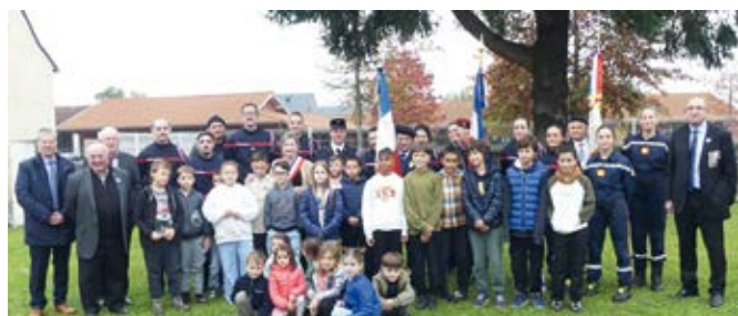
Le 11 novembre 2024

Guerre vous souhaite à toutes et tous, à vos familles, une bonne et heureuse année 2025.