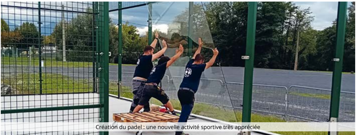
Création du padel : une nouvelle activité sportive très appréciée

Les élus du comité de pilotage de l'aménagement du site sportif et le DGS très heureux de l'ouverture de ce padel.