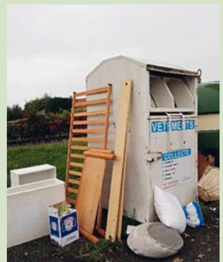
Tout et n'importe quoi devant le bac à vêtements.

Rappel : les sacs noirs contenant des déchets sont interdits dans ce bac jaune, merci pour votre compréhension ! En cas de doute, il vaut mieux mettre les déchets dans le bac violet.