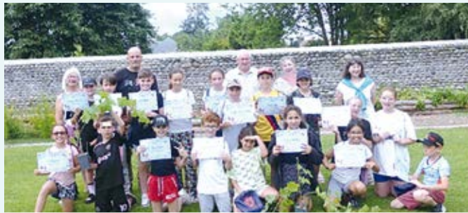
L'exposition organisée par les enfants pour présenter leur escapade

En juin 2024, les élèves de CM2 sont reçus en Mairie, c'est maintenant devenu une tradition pour chaque promotion annuelle.