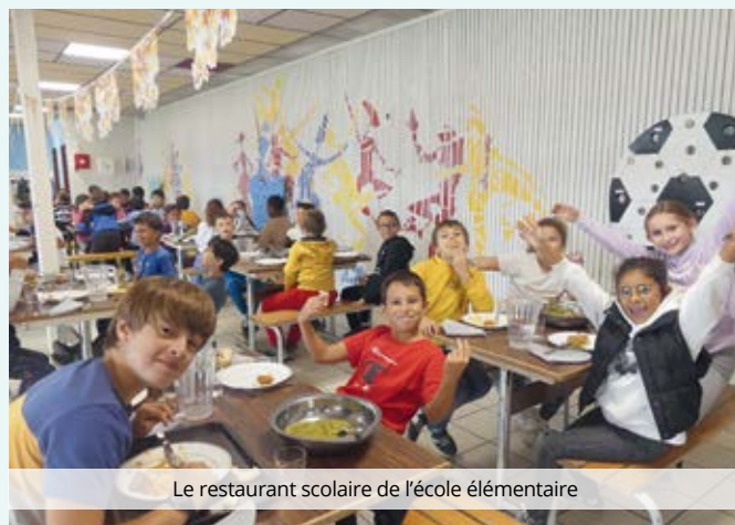
Le restaurant scolaire de l'école élémentaire