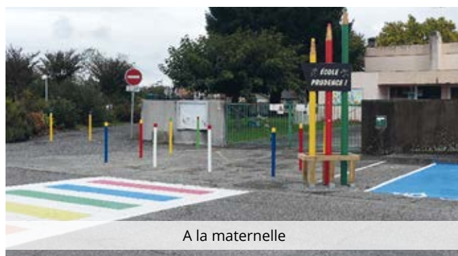
A la maternelle