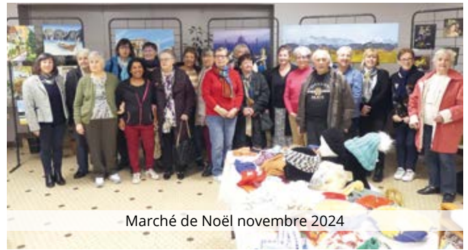
Marché de Noël novembre 2024

L'atelier travaux manuels : à noter que ces Dames ont réalisé des costumes et plus précisément des