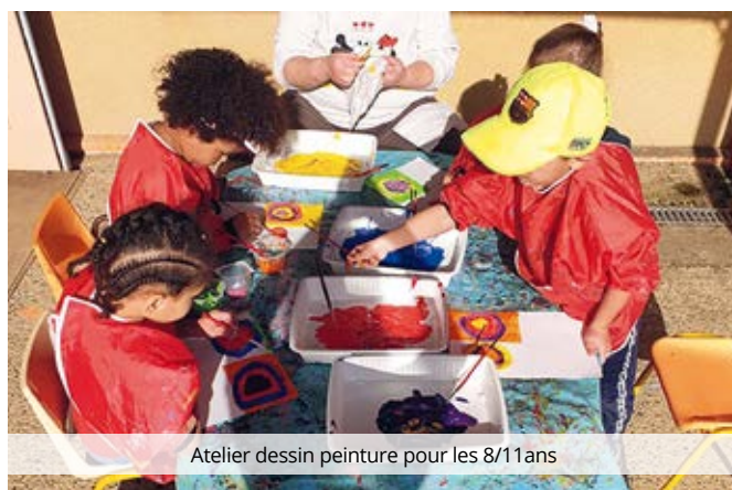
Atelier dessin peinture pour les 8/11 ans

L'accueil de loisirs « Les aventuriers » accueille vos enfants de 4 à 11 ans puis c'est l'« espace jeunes » qui prend le relais de 12 à 17 ans. Les communes de Soues et Barbazan-Debat ont mutualisé les moyens financiers et humains pour proposer cette structure qui répond aux besoins de nombreux parents le mercredi ou pendant les vacances scolaires. Pour toute information, vous pouvez contacter le 05.62.96.28.24 ou 06.45. 65.08.40