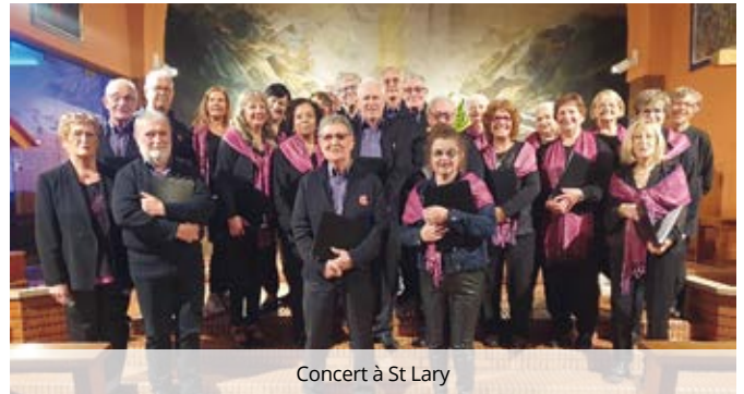
Concert à St Lary

Pour tous renseignements Tél. 06 87 38 02 17 ou Tél. 06 20 45 25.