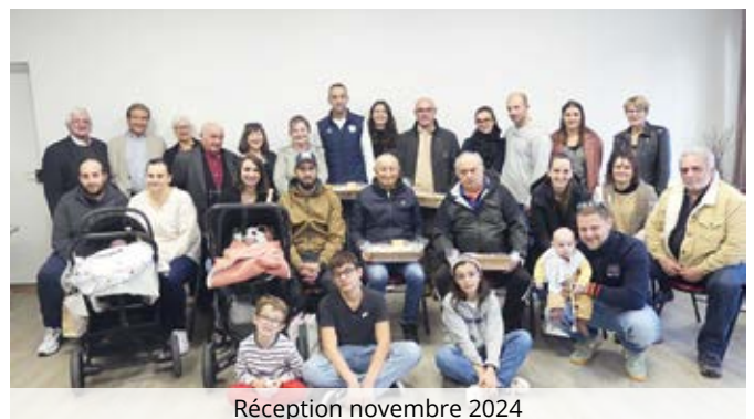
Réception novembre 2024