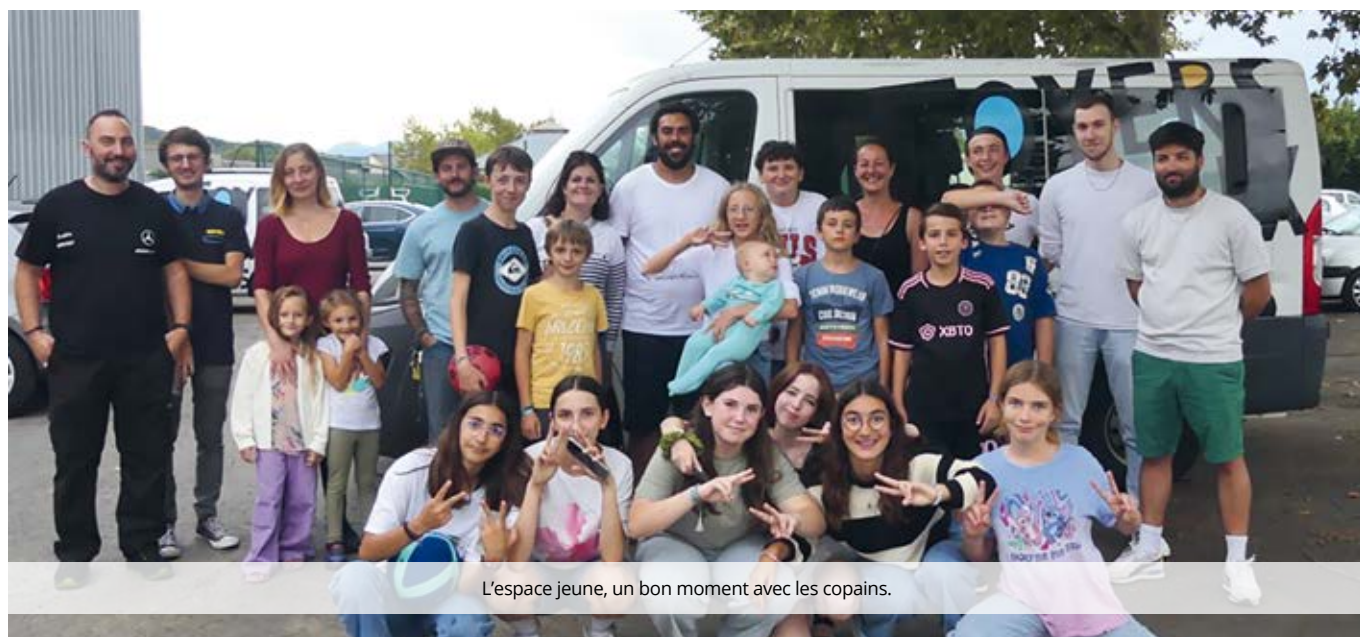
L'espace jeune, un bon moment avec les copains.