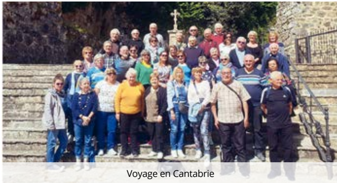
Voyage en Cantabrie

Les bonnes volontés ont été mobilisées pour l'organisation et la réussite du vide-greniers