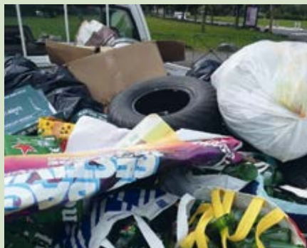
Poubelles ramassées en une matinée à Soues, pneus, bouteilles de bières, sacs divers.....

Ces photos en témoignent et nous révoltent.