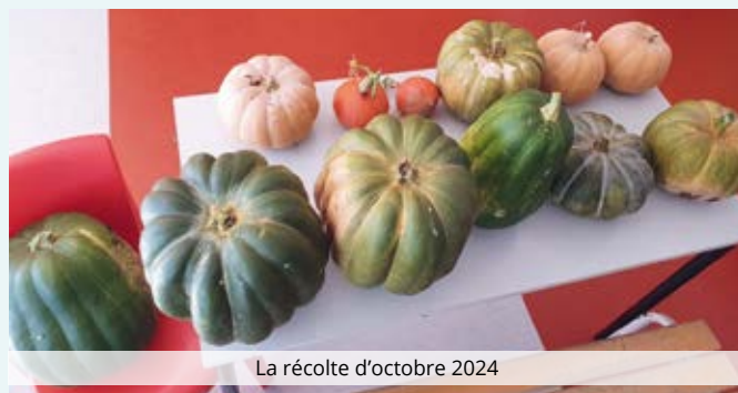
La récolte d'octobre 2024

Le potager construit et entretenu par les agents communaux est largement utilisé par les élèves de l'école et l'équipe enseignante. Les récoltes sont particulièrement abondantes comme le prouvent les 60 kgs de citrouilles récoltées au mois d'octobre. Elles ont été ensuite vendues aux familles et les 100 € de la vente vont permettre d'acheter les prochaines graines et quelques outils supplémentaires.