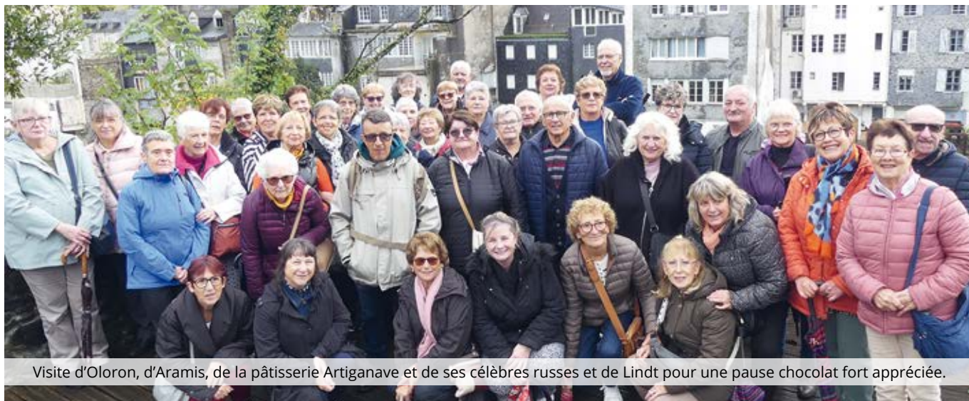
Visite d'Oloron, d'Aramis, de la pâtisserie Artiganave et de ses célèbres russes et de Lindt pour une pause chocolat fort appréciée.

Des résumés de ces voyages peuvent être consultés sur le site du CCAS rubrique voyage.