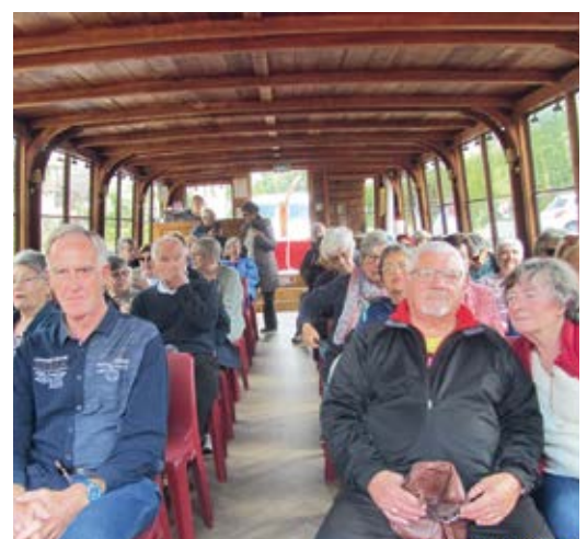
De belles ballades appréciées par tous.