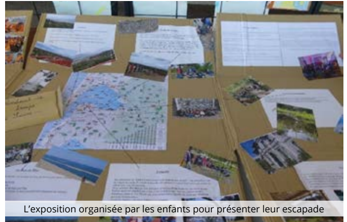
L'exposition organisée par les enfants pour présenter leur escapade

Une belle collaboration qui a permis d'offrir aux élèves un souvenir particulièrement joyeux et pédagogique et pour certains de quitter le cocon familial pour la première fois.