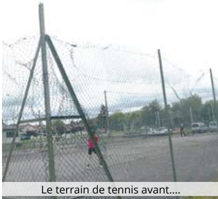
Le terrain de tennis avant....