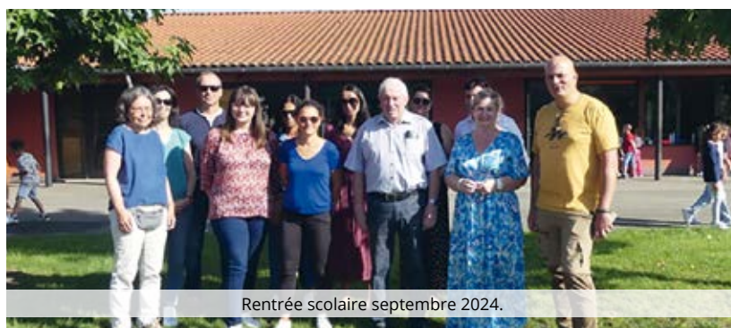
Rentrée scolaire septembre 2024.

L'école est dirigée par Sébastien Brumont. L'équipe pédagogique est composée de 7 enseignants dont une nouvelle venue cette année en la personne de Léa Delas, toute jeune professionnelle récemment diplômée en charge des CE2.