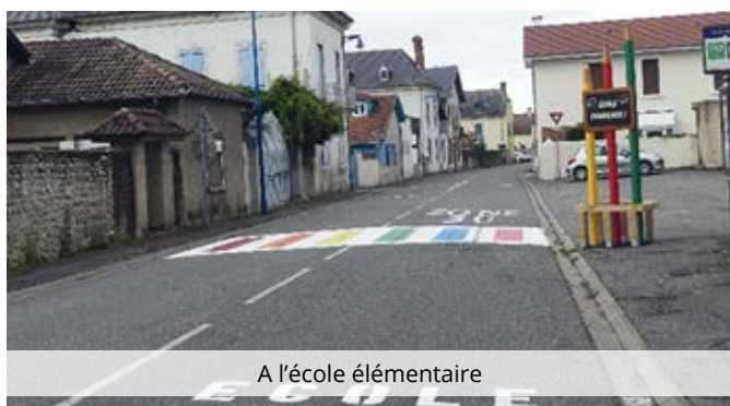
A l'école élémentaire