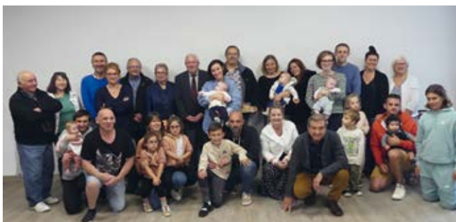
Réception de juin 2024

(Liste arrêtée au 1er décembre pour impression du bulletin)