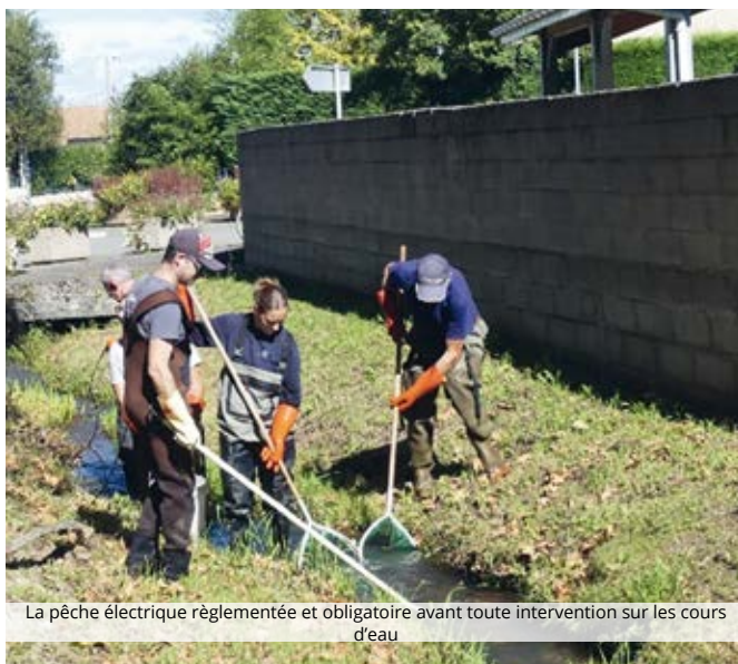
La pêche électrique réglementée et obligatoire avant toute intervention sur les cours d'eau

La première des étapes avant d'intervenir sur le ruisseau doit être de réaliser une pêche électrique. Pour ce faire, la municipalité a fait appel à des partenaires privilégiés : la Fédération de pêche 65 et l'Association Agréée pour la Pêche et la Protection du Milieu Aquatique (AAPPMA)