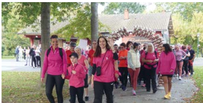
Très belle réussite cette année encore pour Octobre rose qui a vu plus de 300 marcheurs s'élancer dans une ambiance festive et amicale.

Organisée par la municipalité et le comité des fêtes, la manifestation a été un franc succès ce 6 octobre dernier.