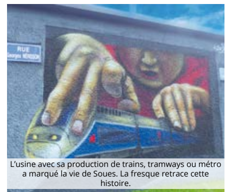
L'usine avec sa production de trains, tramways ou métro a marqué la vie de Soues. La fresque retrace cette histoire.