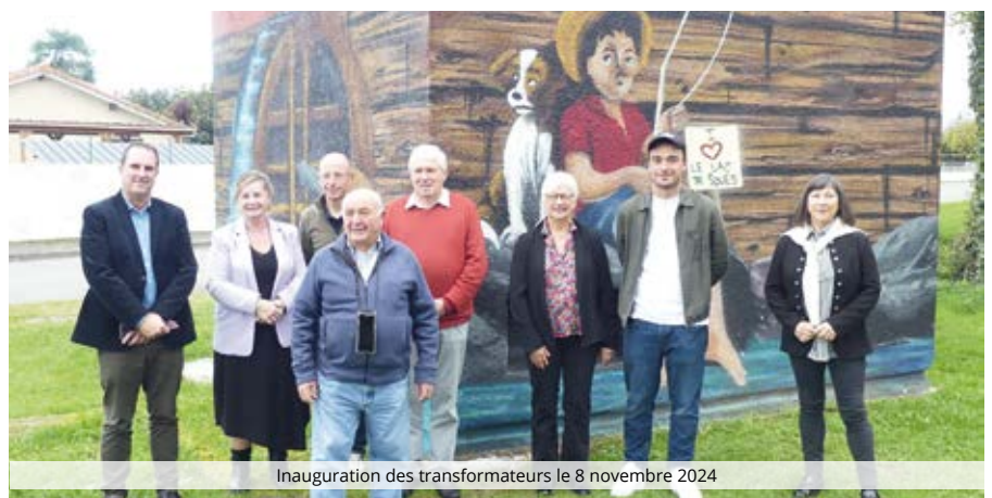
Inauguration des transformateurs le 8 novembre 2024