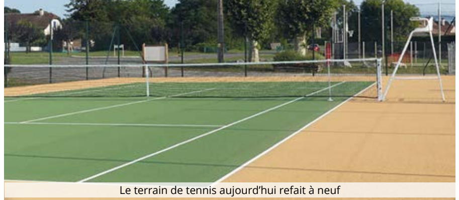
Le terrain de tennis aujourd'hui refait à neuf