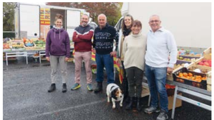
Au marché du mercredi matin

Alors, laissez- vous séduire et allez à la rencontre du marché et des vendeurs.